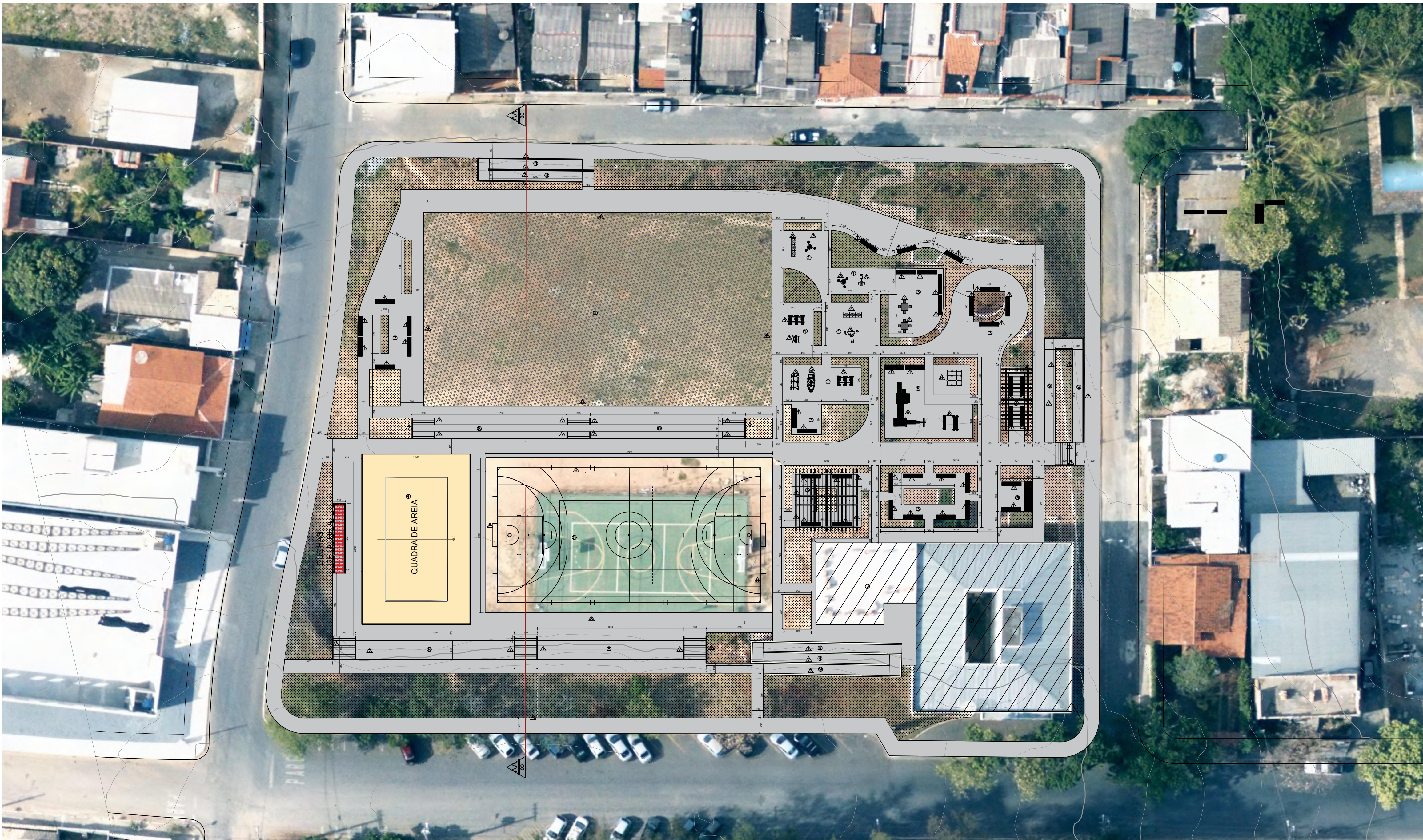
IMPLANTAÇÃO - PRAÇA POR DO SOL ESCALA 1:200